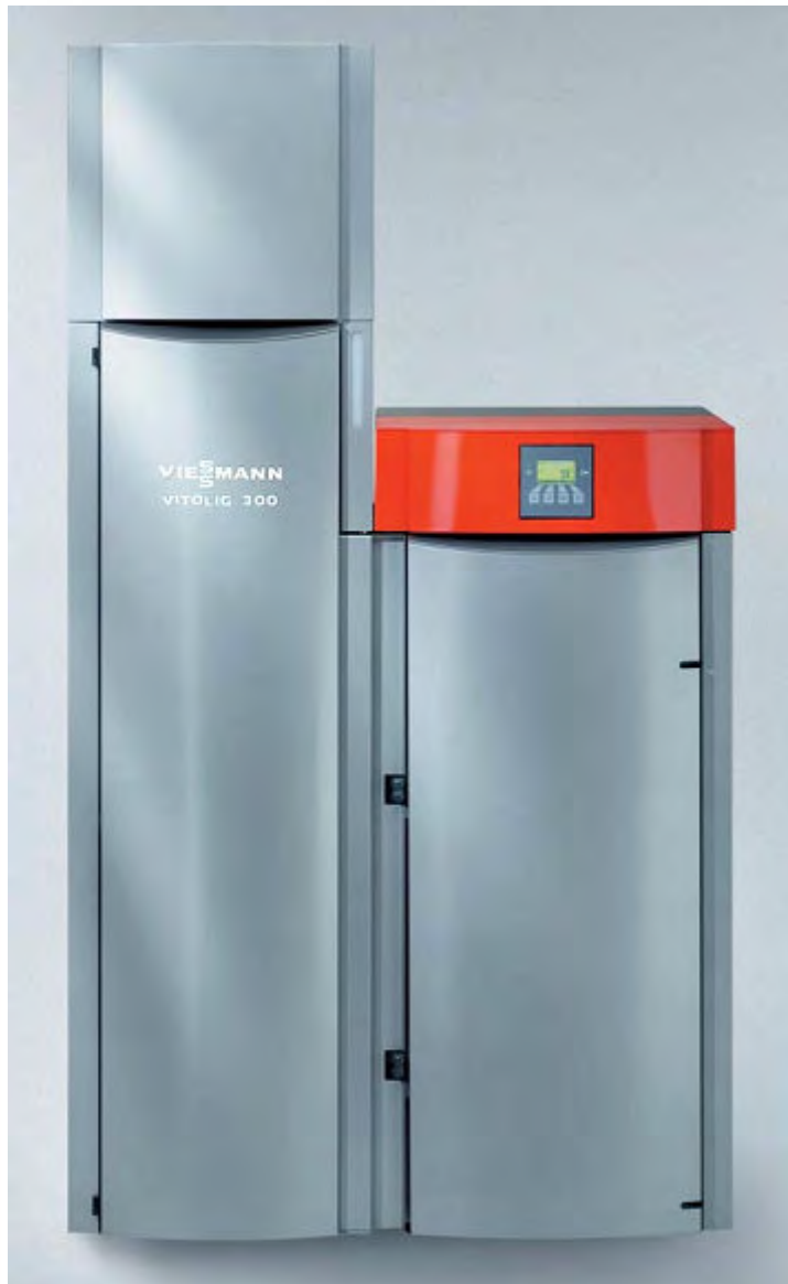
Vitolig 300 – Heizkessel für Holzpellets