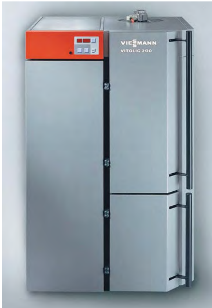
Vitotig 200 – Hochleistungs-Holzvergaserkessel