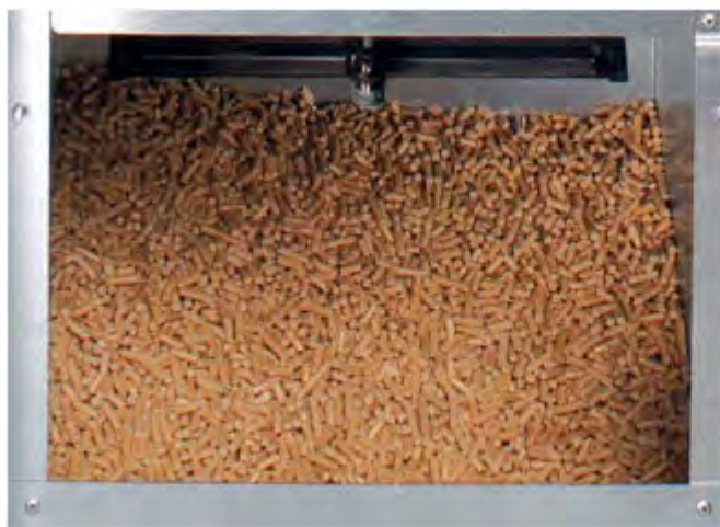
Großer integrierter Pelletbehälter mit 232 Liter Inhalt er- möglicht lange, unterbrechungsfreie Betriebszeiten