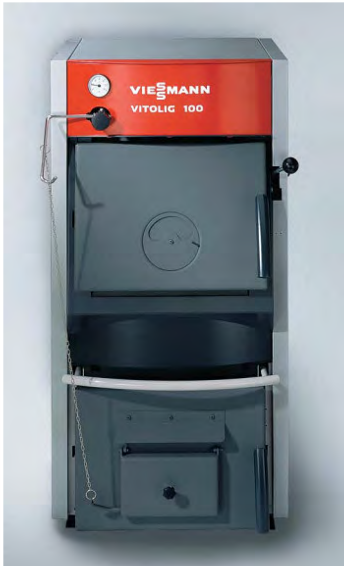
Vitolig 100 - Heizkessel für Scheitholz